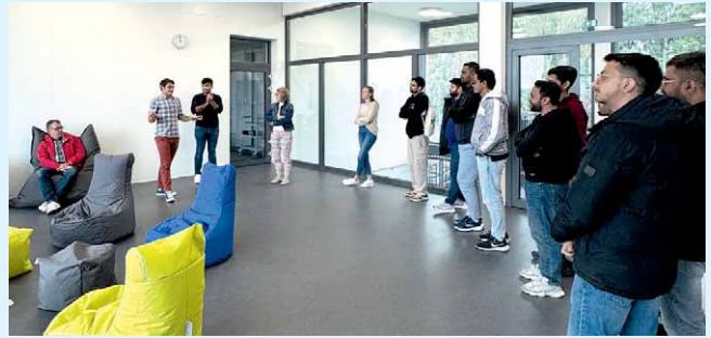
Nicht nur die helle Magistrale zwischen Lehrgebäude und Forschungshalle kam bei den Studierenden gut an.

Die Hochschule Ansbach setzt mit den beiden Masterstudiengängen weiterhin auf ein stark zukunftsorientiertes Studienangebot und reagiert damit auf die steigende Nachfrage nach Fachkräften im Bereich der erneuerbaren Energien und nachhaltigen Bauwirtschaft. Der Campus Feuchtwangen entwickelt sich zusehends zu einem zentralen Standort für Innovation und Forschung in der Region Mittelfranken.