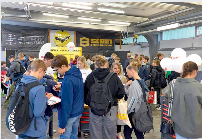
Ein neuer Rekordandrang in diesem Jahr: mehrere tausend Jugendliche informierten sich über die Berufsmöglichkeiten der Region. Insgesamt 94 Unternehmen und Einrichtungen aus der Region präsentierten 120 spannende Tätigkeitsfelder.