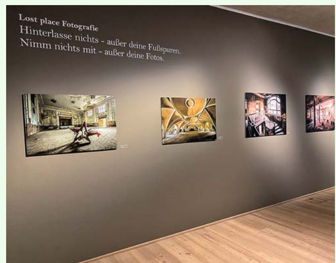
Die Veranstaltung am 30. Oktober findet im Sonderausstellungsraum des Fränkischen Museums statt. Zu sehen sind dort noch bis zum 13. Dezember 2020 die beeindruckenden Fotografien Jörg Schleichers.