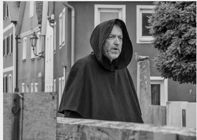
Mönch Froumund von Tegernsee.

Tourist Information Feuchtwangen, Marktplatz 1, 91555 Feuchtwangen, Telefon: 09852/904-55, Fax: 09852/904-250, touristinformation@feuchtwangen.de