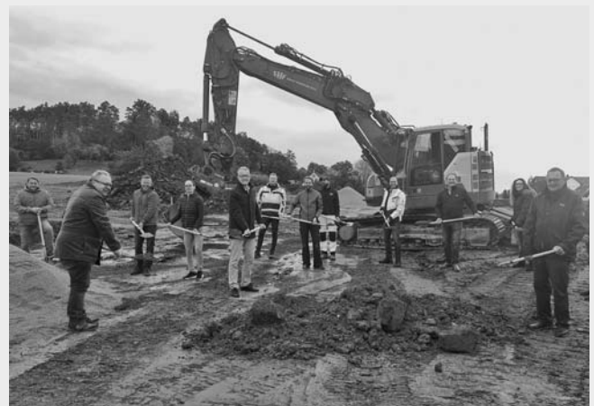
Insgesamt 13 neue Bauplätze entstehen im Feuchtwanger Ortsteil Mosbach. Anfang Oktober läuteten die Beteiligten mit dem symbolischen ersten Spatenstich den offiziellen Beginn der Erschließungsarbeiten ein.

Entsprechend dem Zeitplan soll die Erschließung des Baugebietes „Kirchhofäcker II“ in Mosbach bis Ende des Jahres – geeignete Witterung vorausgesetzt – vollständig abgeschlossen sein. Für die Grundstückseigentümer soll dann voraussichtlich im April 2021 ein Baubeginn möglich sein.