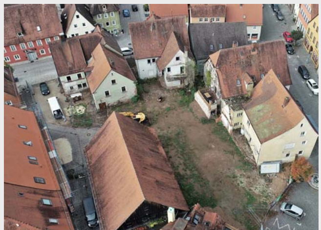
Blick auf das Huppmann-Banse-Areal in der Feuchtwanger Altstadt: Ohne Einigung mit dem Investor kann die Stadt Feuchtwangen derzeit keine neuen Schritte auf dem Gelände einleiten.

Wie berichtet, hatte der Bau- und Verkehrsausschuss (BVA) den vom Investor eingereichten Antrag auf Vorbescheid Ende Mai dieses Jahres einstimmig abgelehnt, da die Bauvoranfrage in mehreren Punkten deutlich von der im Rahmen des KDK ausgehandelten Konsenslösung abwich. In den darauffolgenden Gesprächen hat der Investor schließlich gegenüber der Stadt mündlich angekündigt, keine neuen Pläne für das Huppmann-Banse-Areal in Feuchtwangen einreichen zu wollen.