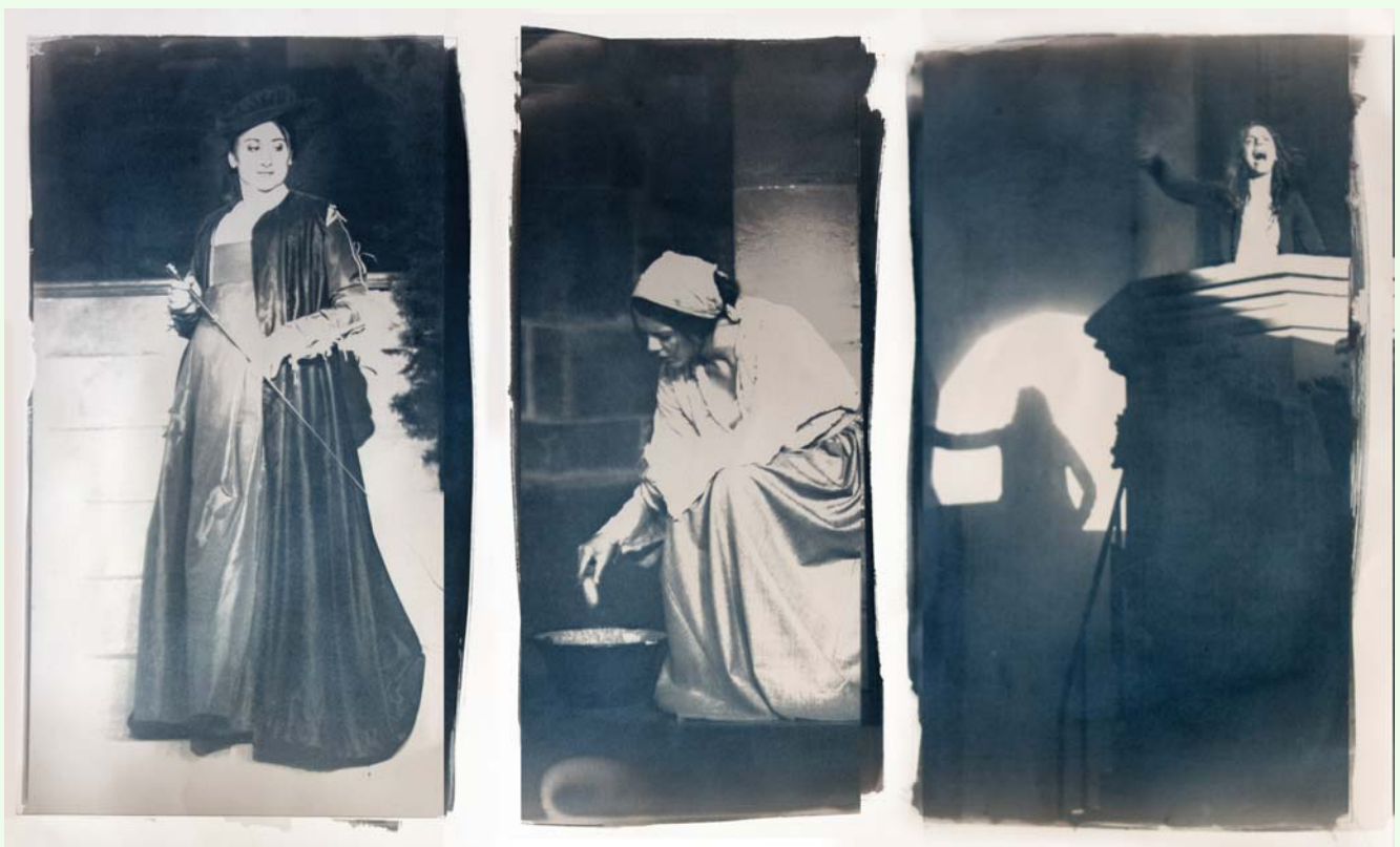
Frank Gerald Hegewald, Szenen aus „Luther“ und „Argula“, 2017, Cyanotypie